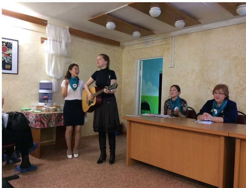
Участники мастер-класса «Музыкальный инструмент – гитара» в рамках проекта «Музыкальный инструмент – гитара» в рамках проекта «Музыкальный инструмент – гитара»