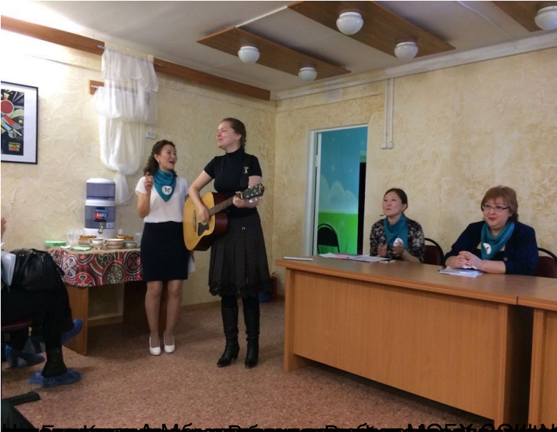
Участники мастер-класса «Создание и презентация творческих проектов»