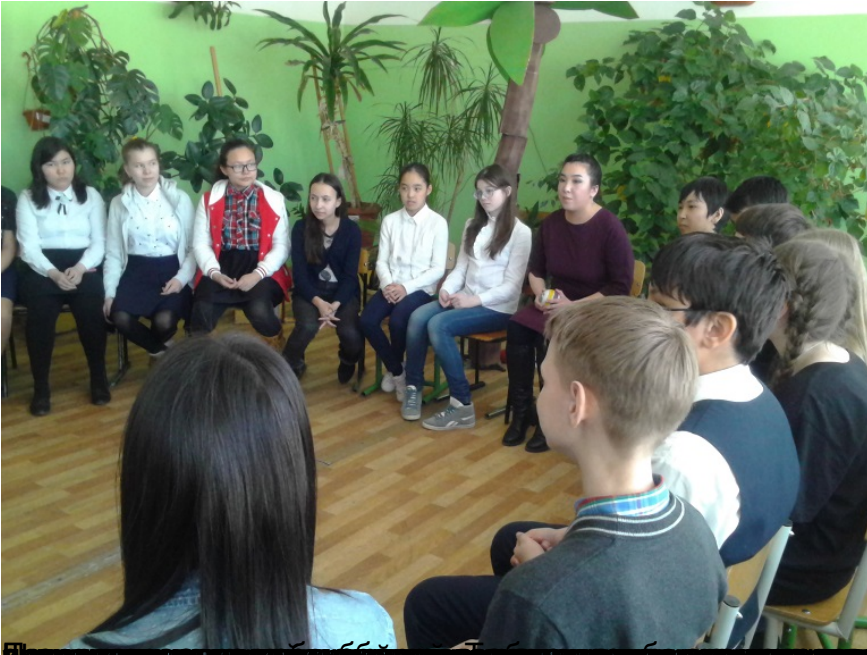
Психологический практикум для обучающихся школ г. Якутска