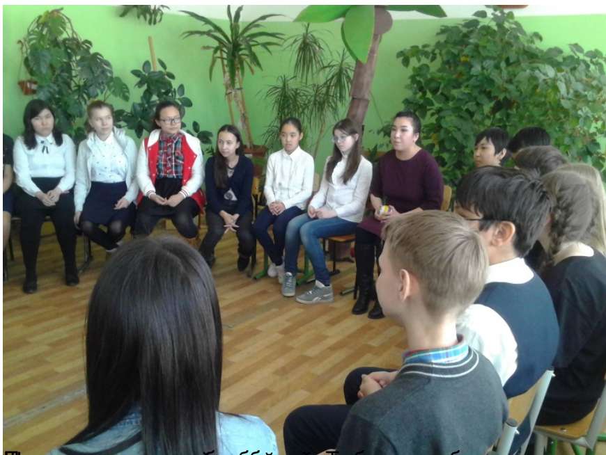
Фотоснимок с выездного психологического практикума для обучающихся школ г. Якутска